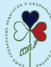
Союз социальных работников и социальных педагогов Российской Федерации