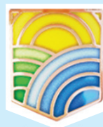
Министерство труда и социальной защиты Российской Федерации